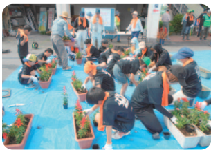
プランターの植栽作業

今年も地域元気アップ活動団体フェニックスONO(男子バレーボール)からたくさん子どもたちが参加して、地域の美化に貢献してくれました。