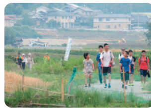
小野ハミングウェイウォーキング

山田の里公園では、地域づくり協議会の支援団体『FURUSATO“美食クラブ”』が小野産小麦「ふくほの香ラーメン」の提供と、山田町の住民有志が地元野菜の販売を行い、今年も好評のうちに終わることができました。