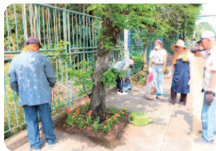
榎山駅構内の植栽作業