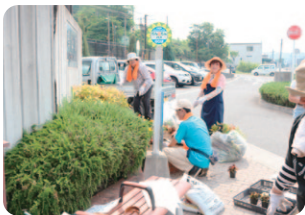
榎山駅花壇の植栽作業