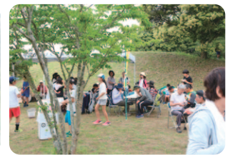
来場者でにぎわう山田の里公園