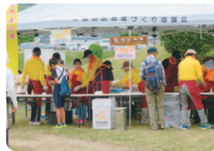
ふくほの香ラーメンの販売